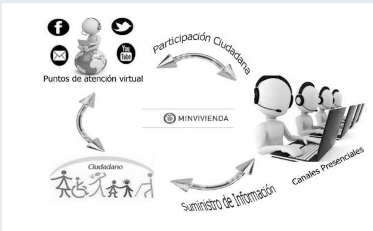
Figura 2 Esquema de Participación Ciudadana

A continuación se presenta el esquema de participación ciudadana definido para el Ministerio de Vivienda, Ciudad y Territorio: