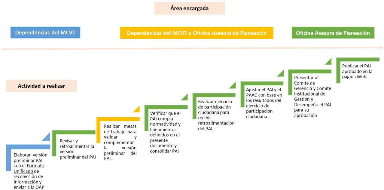
Tabla 3.Ruta para la formulación del PAI

El ejercicio de programación del PAI sigue la siguiente ruta metodológica (ilustración 5):