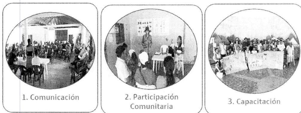
Figura 2. Líneas de intervención del Plan de Gestión Social.

A continuación, se presentan las líneas de intervención que componen el PGS, el cual deberá implementarse de manera articulada entre las entidades involucradas Municipio, Prestador de Servicios Públicos de Acueducto y Alcantarillado (Prestador), ejecutor del proyecto, según correspondan sus obligaciones, y Gestor del Plan Departamental de Agua - PDA en caso que aplique.