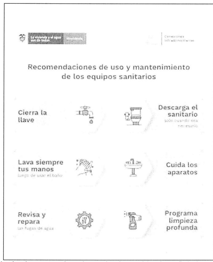
Figura 3. Modelo de elemento a instalar en los inmuebles beneficiados con el PCI.

Nota: Se recomienda elaborar el elemento a instalar en vinilo sobre polietileno (laminado) full color, tamaño carta, calibre 30. A continuación se presenta un modelo de dicho elemento, el cual debe instalarse en las viviendas intervenidas con el PCI. Este modelo es susceptible de modificación en su diseño y contenido, y se presenta con el fin de ilustrar el requerimiento. En el diseño que se defina deben incorporarse los logos de las entidades participantes en el proyecto.