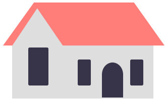
Parámetros de la vivienda