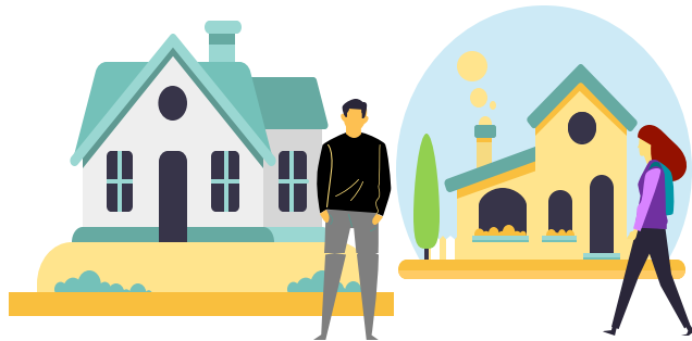
Prototipo Dirección de Vivienda Rural