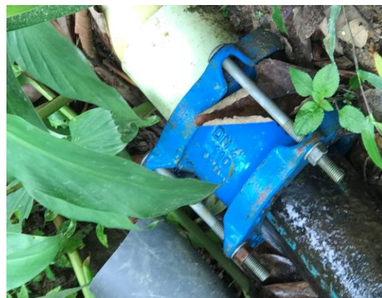
ADUCCION. MUNICIPIO DE VILLARICA, TOLIMA.