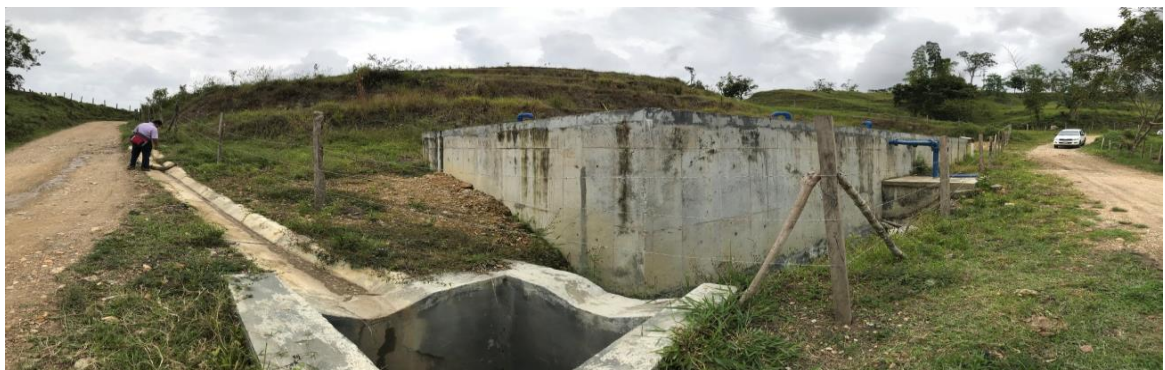
TANQUE DE ALMACENAMIENTO. MUNICIPIO DE VILLARRICA, TOLIMA.