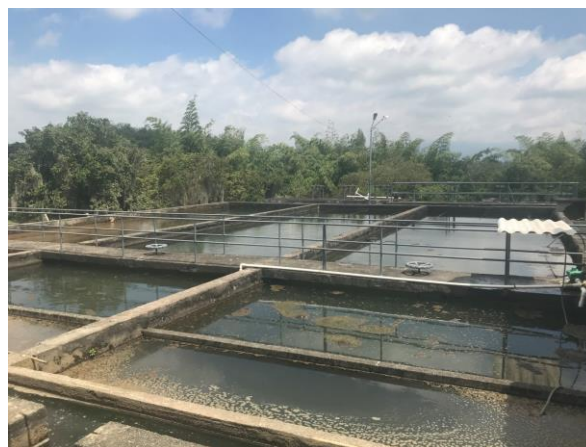
VISTA FLOCULADOR, SEDIMENTADOR Y FILTROS PTAP. MUNICIPIO DE MONTENEGRO, QUINDÍO.