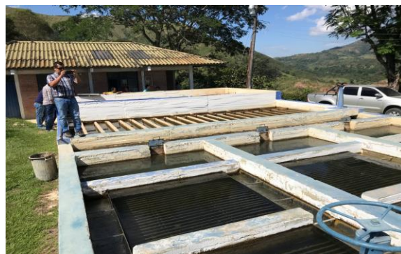
SEDIMENTADOR EXISTENTE. MUNICIPIO DE ROVIRA, TOLIMA