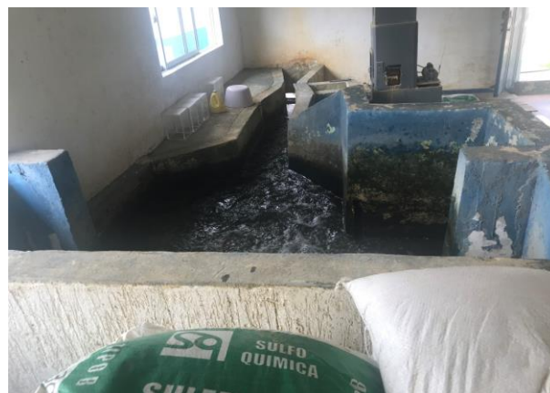
Vista de Vertedero para Mezcla Rapida. Municipio de Montenegro, Quindío.