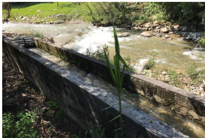
CANALETA PARSHALL Y FLOCULADOR PTAP EXISTENTE. MUNICIPIO DE ROVIRA, TOLIMA