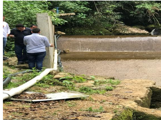
BOCATOMA. MUNICIPIO DE VILLARICA, TOLIMA.