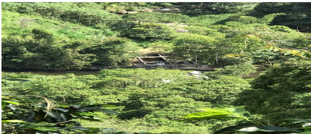
VISTA BOCATOMA Y DESARENADOR- MUNICIPIO DE MONTENEGRO, QUINDIO.