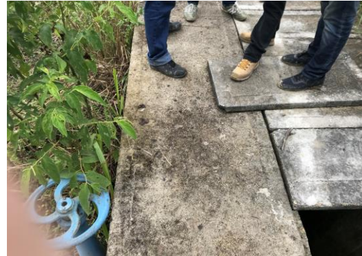
DESARENADOR ABANDONADO. MUNICIPIO DE VILLARICA, TOLIMA