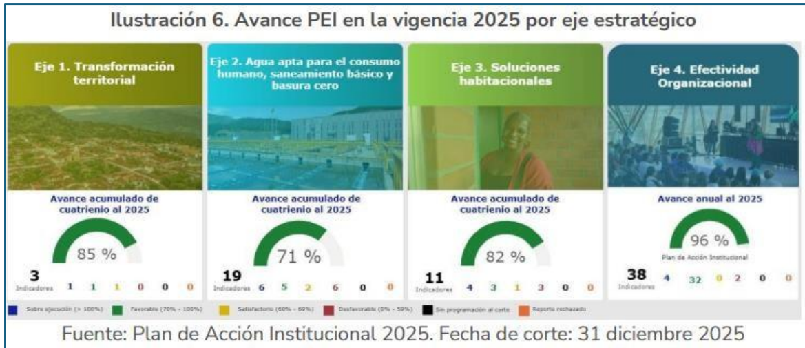
Imagen No. 4.

FORMATO: INFORME DE SEGUIMIENTO Y/O DE LEY AUSTERIDAD DEL GASTO CUARTO TRIMESTRE 2025 PROCESO: EVALUACIÓN INDEPENDIENTE Y ASESORÍA Versión: 11.0 Fecha: 02/04/2025 Código: EIA – F-11