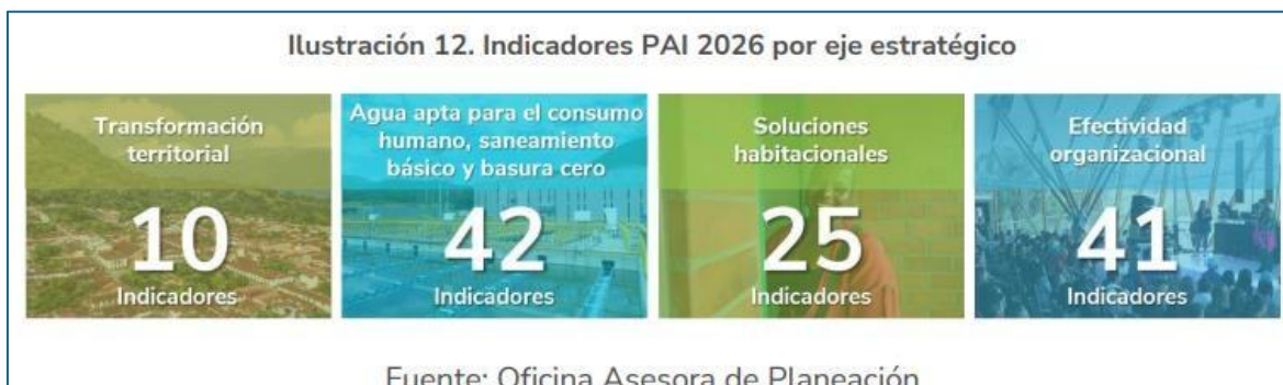
Imagen No.5.

Respecto de la vigencia 2026, “el Plan de Acción Institucional (PAI) 2026 está conformado por 118 indicadores y sus respectivas metas, los cuales se encuentran articulados con las transformaciones definidas en el Plan Nacional de Desarrollo 2022–2026 “Colombia, Potencia Mundial de la Vida”. Cada uno de estos indicadores cuenta con una programación mensual, lo que permite realizar un seguimiento sistemático a su ejecución y disponer de información oportuna para la toma de decisiones por parte de la alta dirección” 1