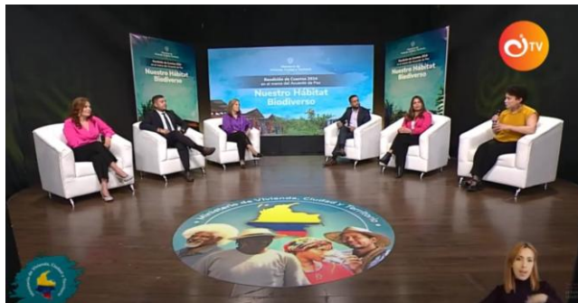
Fuente: Ministerio de Vivienda, Ciudad y Territorio. 22 de mayo del 2025

La ciudadanía interesada puede consultar módulos de capacitación del Plan Nacional de Formación para el Control Social en el siguiente enlace: Control Social - Rendición de Cuentas - Función Pública (funcionpublica.gov.co) . En el Ministerio, la ciudadanía puede consultar las convocatorias a control social y ejercicios de rendición de cuentas en el siguiente enlace institucional registrado en el Menú participa institucional: https://minvivienda.gov.co/participa/consulta-ciudadana . De igual forma, para efectos de consulta de los contratos celebrados en la vigencia 2024, lo invitamos a visitar los siguientes enlaces. Allí indique el nombre de la Entidad y el número de contrato en el espacio señalado “Buscar Proceso de Contratación” y luego seleccione “Buscar”. https://lc.cx/ljYeFg