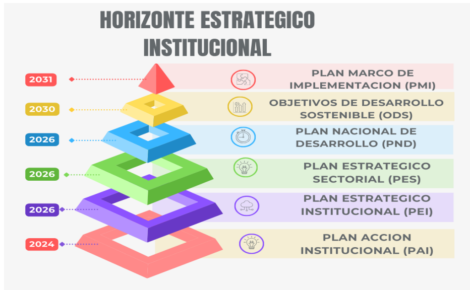
Figura 3. Horizonte estratégico institucional

Ciudad y Territorio en el momento que el Ministerio de Ambiente y Desarrollo Sostenible y el Departamento Nacional de Planeación aprueben el Plan de Acción y Seguimiento y los indicadores formulados para dar cumplimiento a la norma mencionada.