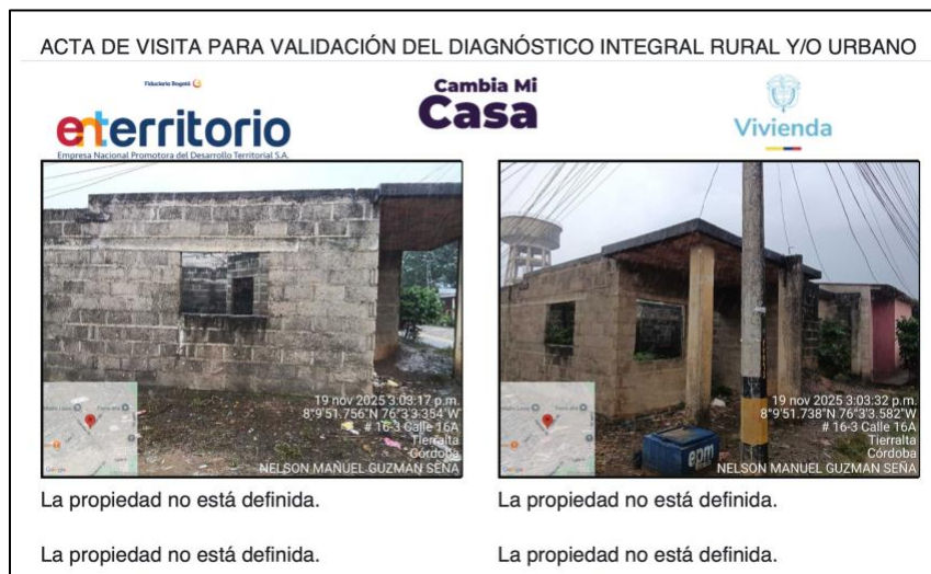
Fuente. Acta de Visita validación diagnóstico - Enterritorio

Que mediante correo electrónico de fecha 13 de enero de 2025, Enterritorio en calidad de supervisor, en cumplimiento de las obligaciones adquiridas en el marco del Contrato N° 224004 ENT - 02 Fidubogotá, remitió acta de visita para validación del diagnóstico integral rural y/o urbano de la vivienda postulada en donde se determinó "Vivienda sin cubierta ni ventanas e inhabitada" - "la propiedad no está definida" dictaminando no ser una vivienda apta para ejecución de mejoramiento