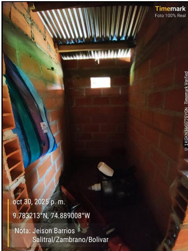
Intervención 5 antes