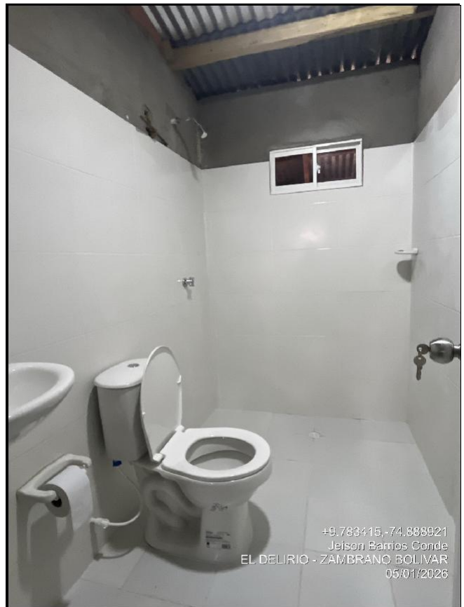
Intervención 5 después