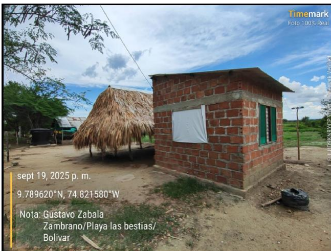
Intervención 3 antes