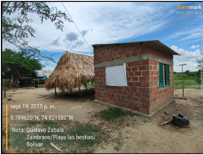
Intervención 2 antes