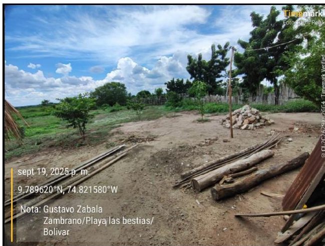
Intervención 5 antes