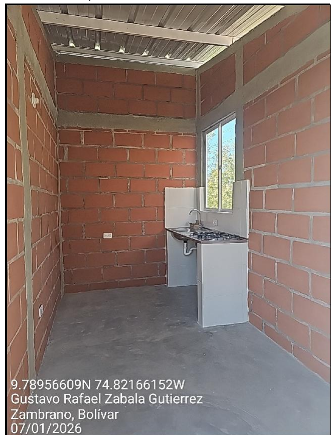
Intervención 5 después