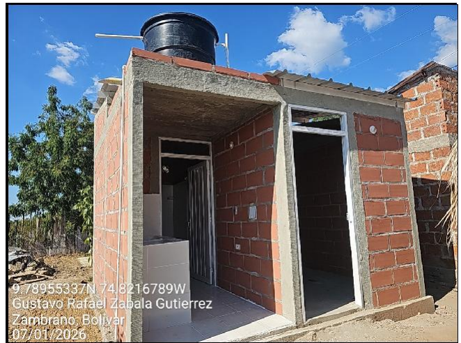
Intervención 2 después