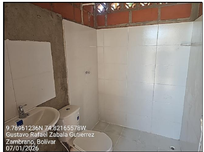
Intervención 4 después