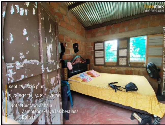
Intervención 4 antes